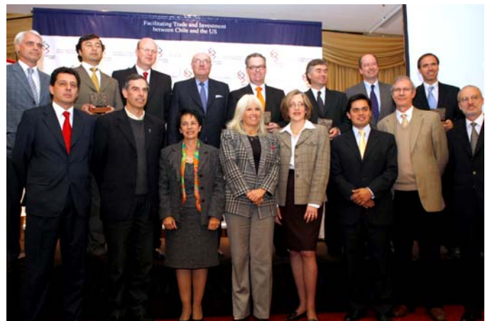
Representantes de los Reportes ganadores junto a los miembros del jurado del Premio al Buen Ciudadano Empresarial de AmCham.